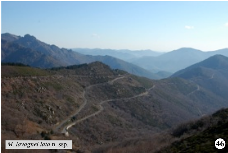
M. lavagnei lata n. ssp.